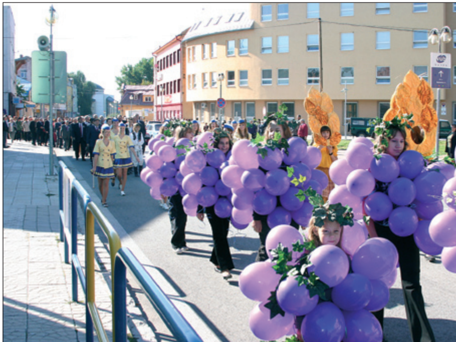
Úvodný sprievod Tradičného Sobranského jarmoku 2007