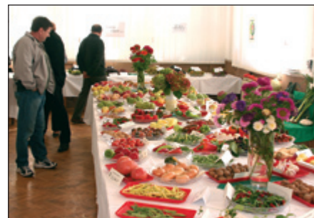
Výstava ovocia a zeleniny