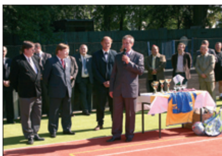
Otvorenie a uvedenie do prevádzky viacúčelo- vého ihriska