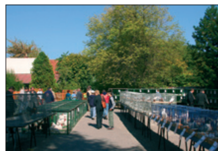
Výstava malých hospodárskych zvierat