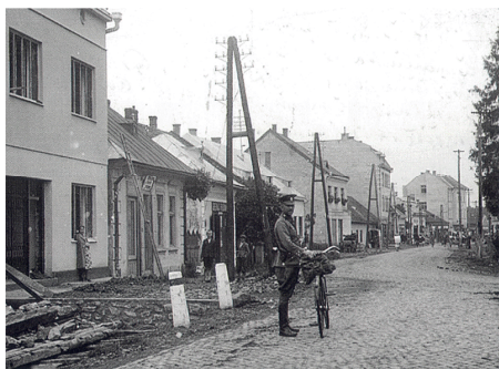
Hlavná ulica v roku 1935