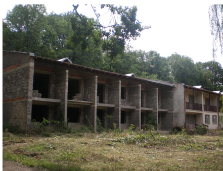
Nedokončený liečebný pavilón