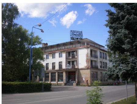
Hotel Morské oko