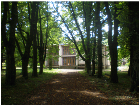
alej v kúpeľoch