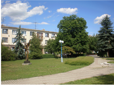
park na Námestí slobody