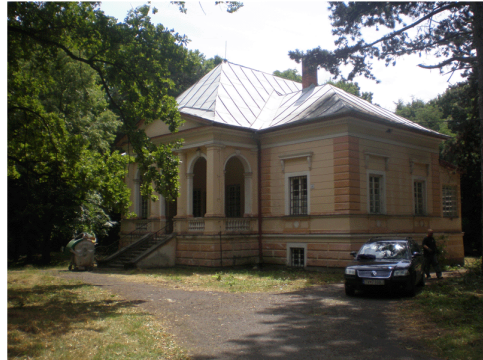
NKP - vila Varady