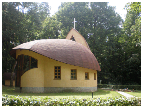
kaplnka v kúpeľoch