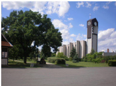
Rímsko - katolícky kostol