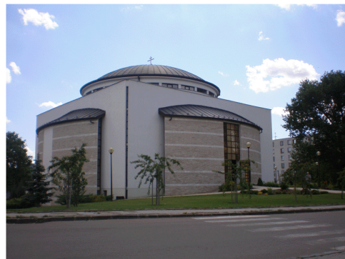
Grécko - katolícky chrám