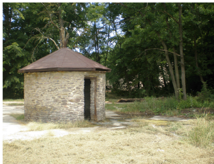
Prameň liečivej vody