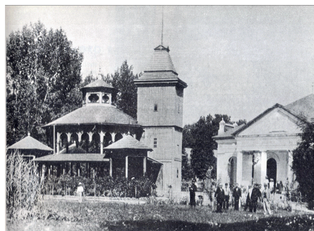
Kúpele začiatkom 20. storočia