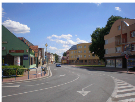
Štefánikova ulica v roku 2007